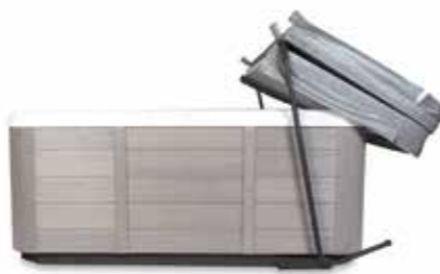
Lève couverture LC7