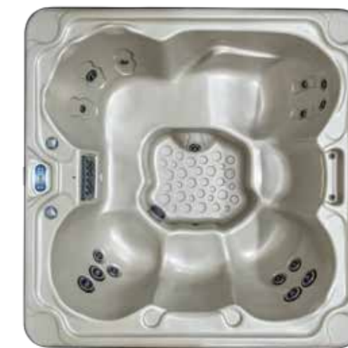
ROYALE P 1980 X 1980 X 860 mm Nombre de jet : 21 1 place allongée / 5 sièges