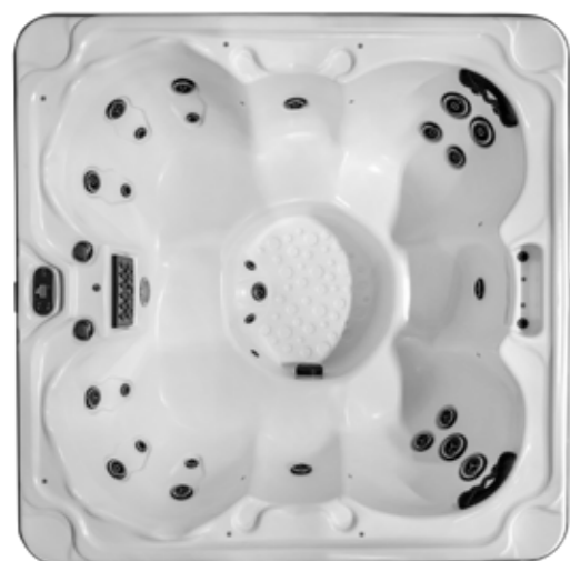
REGAL & REGAL ETS 1980 X 1980 X 860 mm Nombre de jet : 31 7 sièges

La convivialité est assurée dans ce spa équipé exclusivement de sièges. Dans chaque angle, vous retrouverez des fauteuils très confortables avec d'importants massages, intercalés par des sièges d'attente moins équipés pour le repos du corps entre deux puissants massages.