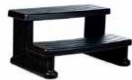
STEP I NOIR