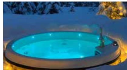
Chromothérapie : 1 spot principal 1 rang de leds sous la ligne d'eau 1 rang de leds sur le pourtour de la cuve 4 leds angle d'habillage