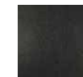
Black Simili cuir Série P