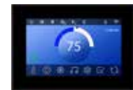
Mini Spa Touch 3 Série VIKING