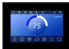
Spa Touch 3 Série ELITE