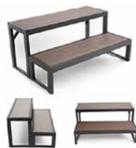
Marche Design CORE NOIRE