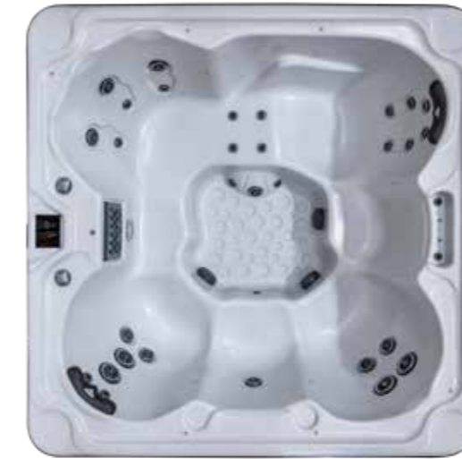
ROYALE ETS 1980 X 1980 X 860 mm Nombre de jet : 31 1 place allongée / 5 sièges

C'est le best seller de la gamme ! Sa taille standard et son bon équipement en jets de massage en font le spa idéal. Le Royale ETS offre un massage plus tonique et vigoureux. A chacun, son modèle mais pour le plaisir de tous !