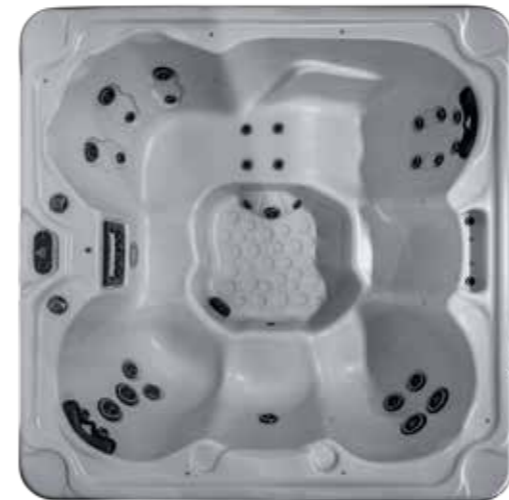
ROYALE 1980 X 1980 X 860 mm Nombre de jet : 31 1 place allongée / 5 sièges

Un petit emplacement pour un spa qui tiendra ses promesses en terme de massage. Equipé du massage en réflexologie, mains et pieds, ce spa a tout d'un grand. Il s'installera sur une terrasse ou un endroit dédié sans prendre tout l'espace.