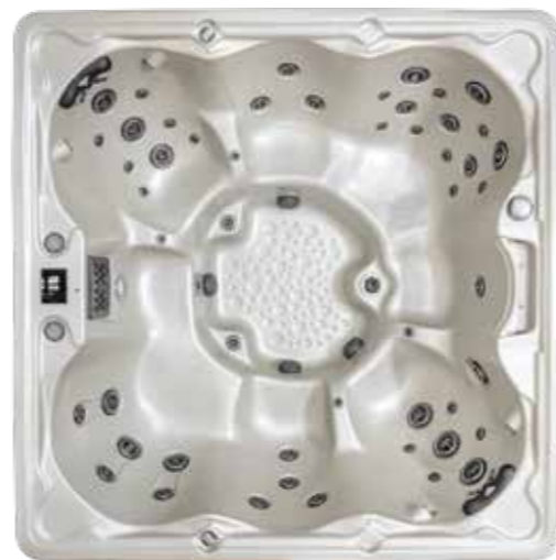
TRADITION I : 61 jets TRADITION II PREMIUM : 71 jets 2340 X 2340 X 950 mm 8 sièges

Un spa hyper confortable qui pense que le massage c'est mieux « assis » ! Très convivial, ce spa vous apportera toute satisfaction. Version Premium pour les adeptes des massages variés et puissants, et du confort.