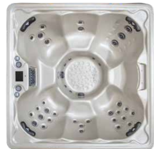
LEGACY I : 41 jets LEGACY II PREMIUM : 51 jets 2180 X 2180 X 950 mm 7 sièges