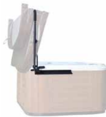
Lève couverture LC1