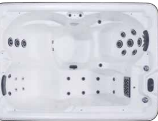
AURORA III 1520 X 2130 X 860 mm Nombre de jet: 31 1 place allongé / 2 sièges