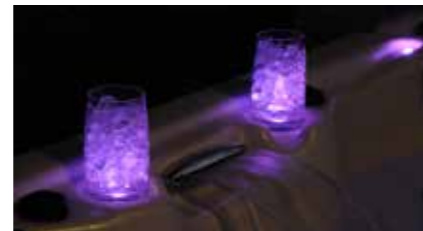
Porte verre - chromothérapie Série ELITE PREMIUM