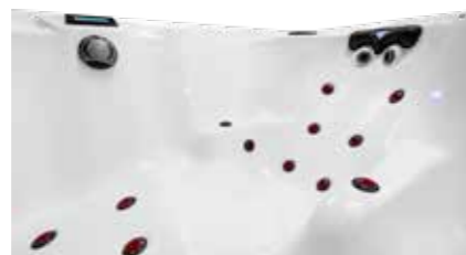
Air X Jets Série ELITE PREMIUM