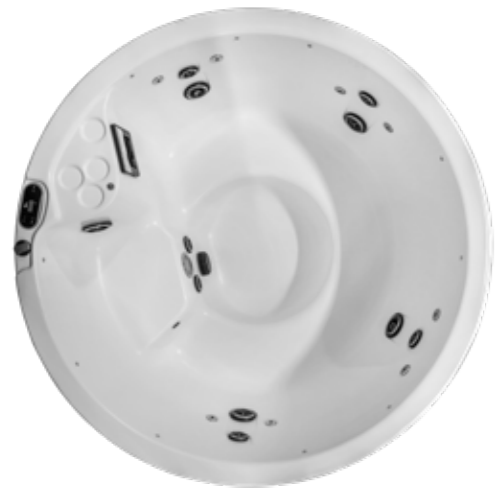
VIKING III 1830 dia X 890 mm Nombre de jet : 20 4/5 places

L'intemporel spa rond, idéal pour la famille et les retrouvailles entre amis. La circulation intérieure est facilitée grâce à la banquette libre qui fait le tour du spa. Chacun y trouvera sa place pour son plus grand confort.