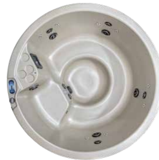
VIKING P 1830 dia X 890 mm Nombre de jet : 20 4/5 sièges

P comme Pro ! Cette série est dédiée aux installations dans les lieux publics ou professionnels tels que les gîtes, les campings ou les locations. Ces modèles très économiques sont connectables sur une simple prise de courant, ce qui en facilite l'installation. L'utilisateur profitera de tous les avantages de l'hydrothérapie par l'eau chaude avec toute la simplicité d'utilisation de ces modèles.