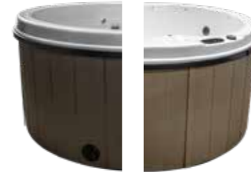
Spas ronds uniquement disponibles en Walnut et Coastal Grey