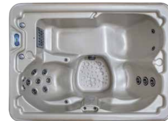
AURORA P 1520 X 2130 X 860 mm Nombre de jet : 17 1 place allongée / 2 sièges