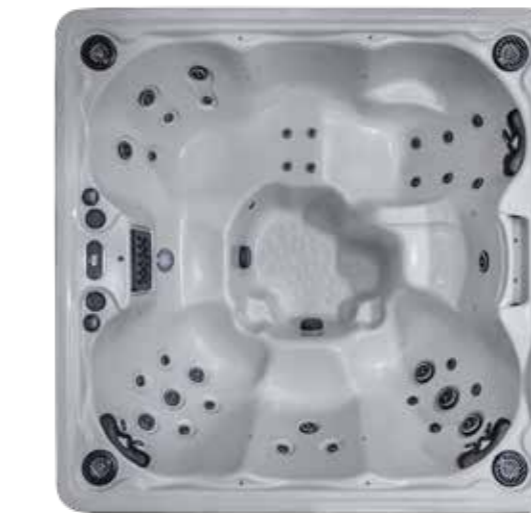
LEGEND I : 41 jets LEGEND II PREMIUM : 51 jets 2180 X 2180 X 950 mm 1 place allongée / 6 sièges