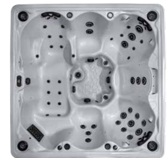
HERITAGE I : 61 jets HERITAGE II PREMIUM : 71 jets 2340 X 2340 X 950 mm 1 place allongée / 5 sièges

Avec ses massages en reflexologie, ce spa très complet vous apporte tous les massages possibles sur toutes les parties de votre corps. La version Premium est idéale pour les adeptes des massages variés et puissants, et du confort.